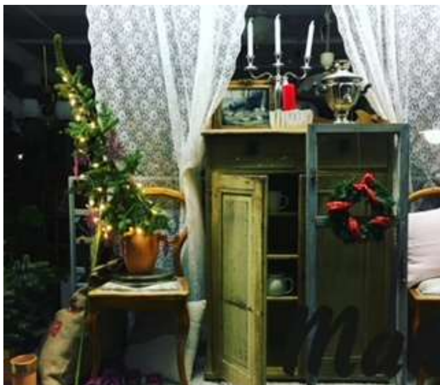
Tunnelmallinen Makasiini joulun aikaan.